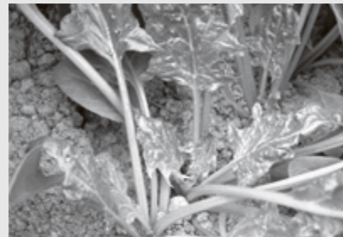
▲ホウレンソウケナガコナダニによる被害

ホウレンソウケナガコナダニはハダニ類とは異なり気門を持たないため、サファイールなどの気門封鎖剤の効果が低く防除をするにも薬剤が少ない状況でした。