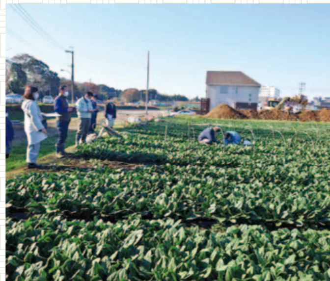
出品数16点を総合審査 流山ホウレンソウ共進会

松戸市梨研究会は12月16日、梨剪定講習会を開きました。生産者は、千葉県農林総合研究センター果樹研究室の押田室長を講師に迎え、来シーズンに向けた作業のポイントを学んでいました。午前は、五香・金ケ作と六実地区の生産者向けに行われ(写真)、午後は、高塚地区の生産者向けに行われ、それぞれ15人が参加しました。