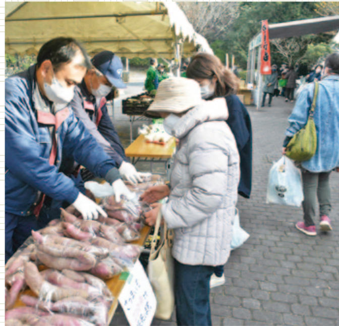
流山産がいっぱい 生産者がお客様をおもてなし

流山市農産物直売所「新鮮食味」は12月12日、感謝祭を開きました。生産者は、市内産のホウレンソウ・白菜・小松菜など旬の新鮮野菜を販売しました。また、1,000円以上購入されたお客様に、米またはサツマイモのプレゼント企画もありました。