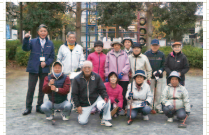
ハツラツプレーで「コロナに負けるな！」 グラウンドゴルフ大会開く

鎌ヶ谷市梨業組合は12月4日、梨剪定講習会を初富のほ場で開き、27人が参加。生産者は、良品生産に向けた技術の向上を図りました。