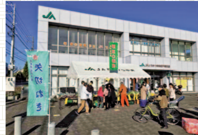
松戸南支店で即売会開催 地場産を求めて多数のお客様が来店

松戸市農事研究会矢切総支部は12月1日、松戸南支店で農産物即売会を開きました。生産者は、矢切ねぎやキャベツなど旬の農産物を対面で販売。鍋物や年末の食材として、まとめ買いするお客様の様子がありました。