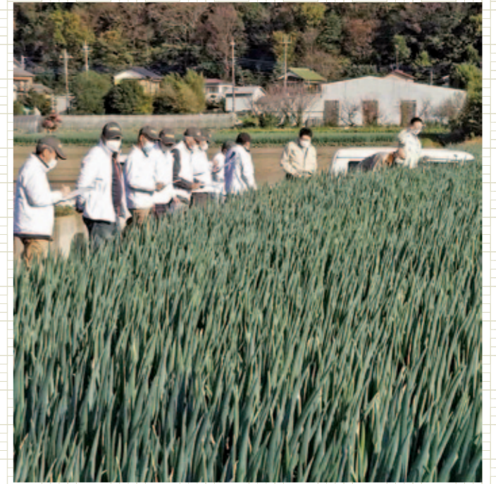
11点が慎重審査される 自慢の「矢切ねぎ」の出来栄を競う

松戸市農事研究会矢切総支部は12月1日、松戸南支店で農産物即売会を開きました。生産者は、矢切ねぎやキャベツなど旬の農産物を対面で販売。鍋物や年末の食材として、まとめ買いするお客様の様子がありました。