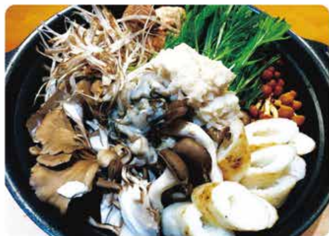
いろいろなキノコと カキのみぞれ鍋