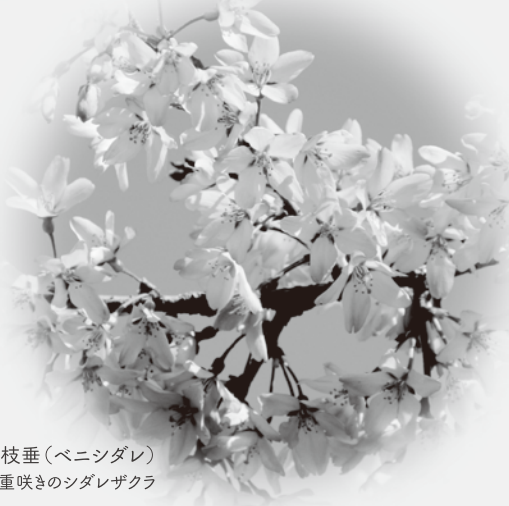
紅枝垂(ベニシダレ) 一重咲きのシダレザクラ