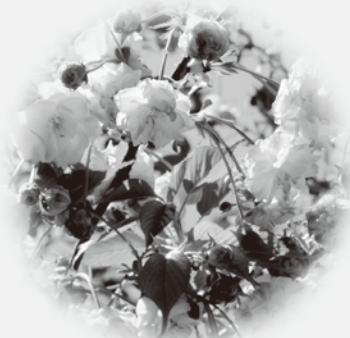
園里黄桜(ソノサトキザクラ) 黄緑色の花が特徴的