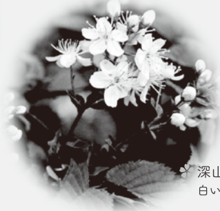
深山桜(ミヤマザクラ) 白い花の咲く野生種