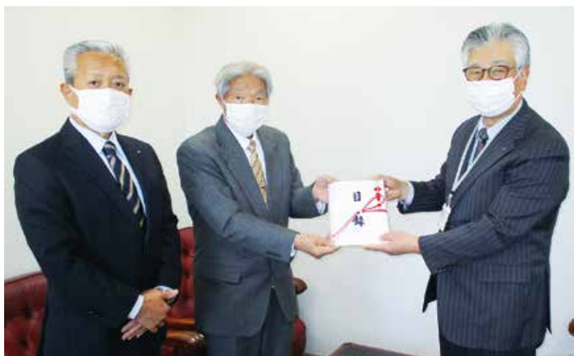
▲ 石渡会長(中央)に贈りました