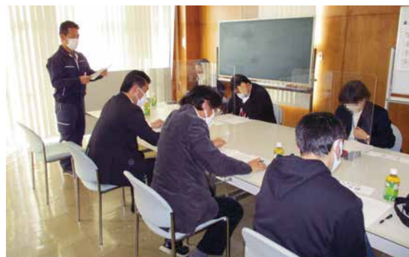
▲ 千葉県東葛飾農業事務所や松戸市農政課など関係機関が慎重審議