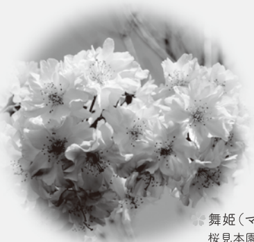
舞姫(マイヒメ) 桜見本園で作出された新品種

お花見には人それぞれの楽しみ方があり、桜も咲き方や散り方の違いなど、いろいろな形で私たちを楽しませてくれます。川や池の水面に浮かぶ花びら、地面を埋める花びら、花が散った後の桜の木も風情があります。今年も引き続き新型コロナウイルスの影響を考慮して、感染対策を取って少人数で静かに楽しむことが望ましいでしょう。