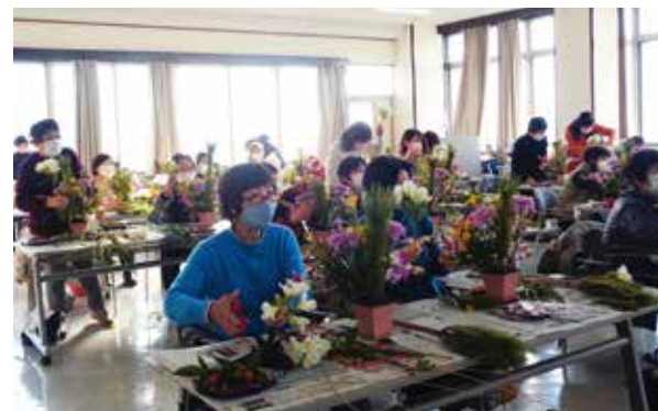
▲ 講師のお手本を見て花飾りを作る、八木支部のみなさん。

流山女性部流山支部は12月28日流山支店で、フラワーアレンジメント講習会を開きました。同様に、八木支部は12月29日八木支店で開きました。