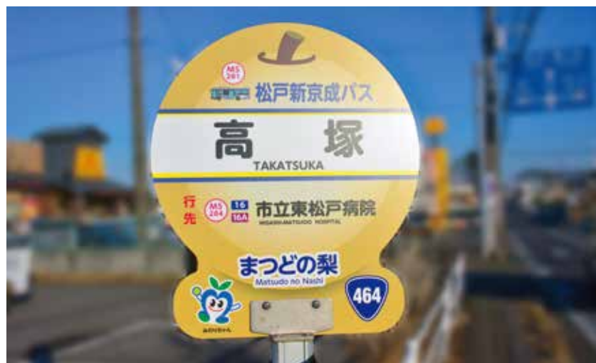
▲ 「みのりちゃん」がデザインされた標識