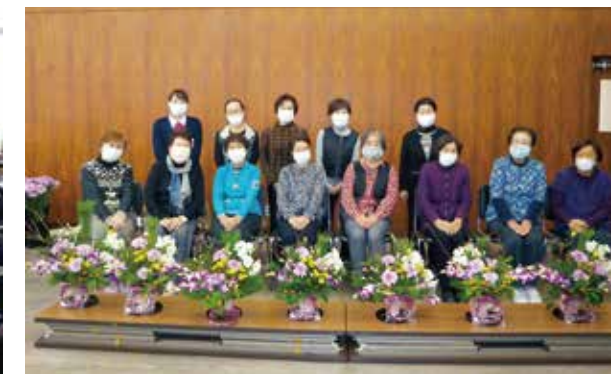
▲ 完成した花飾りを前にして、流山支部のみなさん。