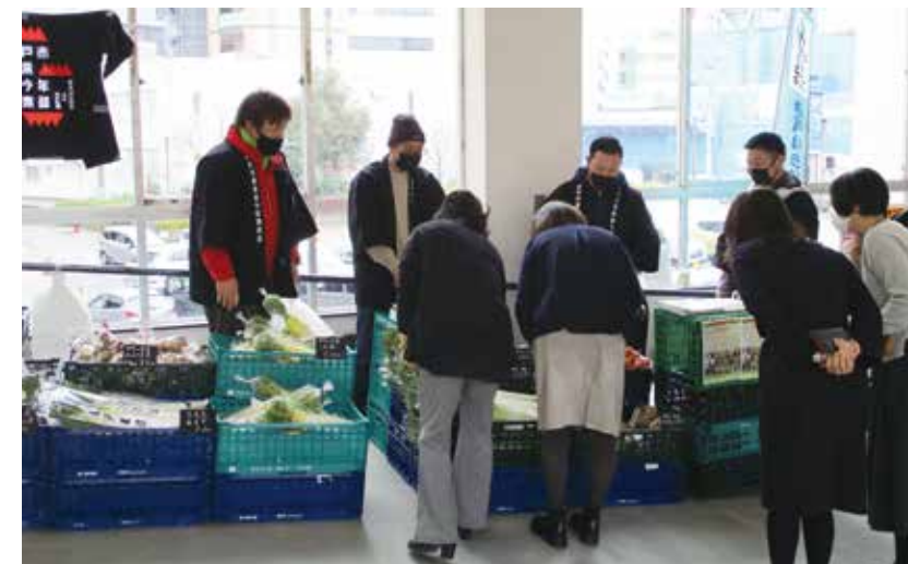
▲ 4Hのロゴが印字されたはっぴを着て接客

会場では、にんじん・生落花生・ブロッコリー・ねぎなどが販売されました。生産者は、買い物客一人一人の好みに合う品をすすめるなど、丁寧に接客していました。