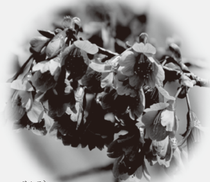
寒緋桜(カンヒザクラ) 半野生。沖縄県では1月から咲く