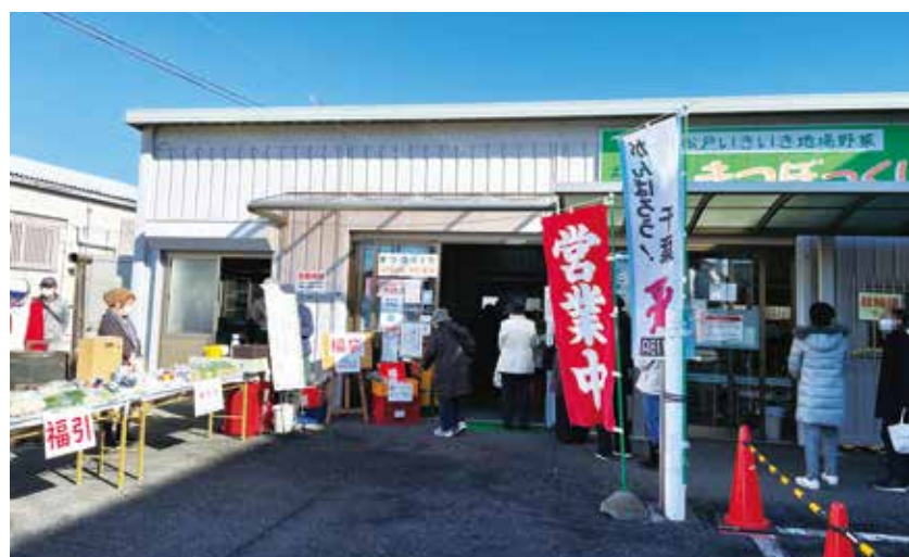
▲ 「初売り」に来店するお客様