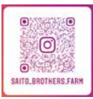
▲ 齊藤農園のSNS (インスタ)はこちら。

また、「地元の人にもっと食べてもらいたい」と思い、「それなら直売所をまずはやってみよう」と、二十世紀が丘丸山町の駐車場の一部を父から借りて始めました。最初は小さな少数のボックスから始めて、少しずつ試す中で、直売所が市場出荷に変わり中心になりました。 商品補充は一日四回程。直売所は一年を通して、毎日新鮮なものに変わることが強みです。定番の旬野菜から、ちよつと珍しいものまであり、来る度に変化のあるわくわくする直売所を目指しています。 また、手書きで野菜の食べ方や特徴を書いたりして、親近感を感じてもらえる一手間を続けています。単品で売らなくても、サラダセットもあつて、人気商品の一つです。 一度、直売所を覗いて、ご賞味ください。お会いした時は、お声がけください。