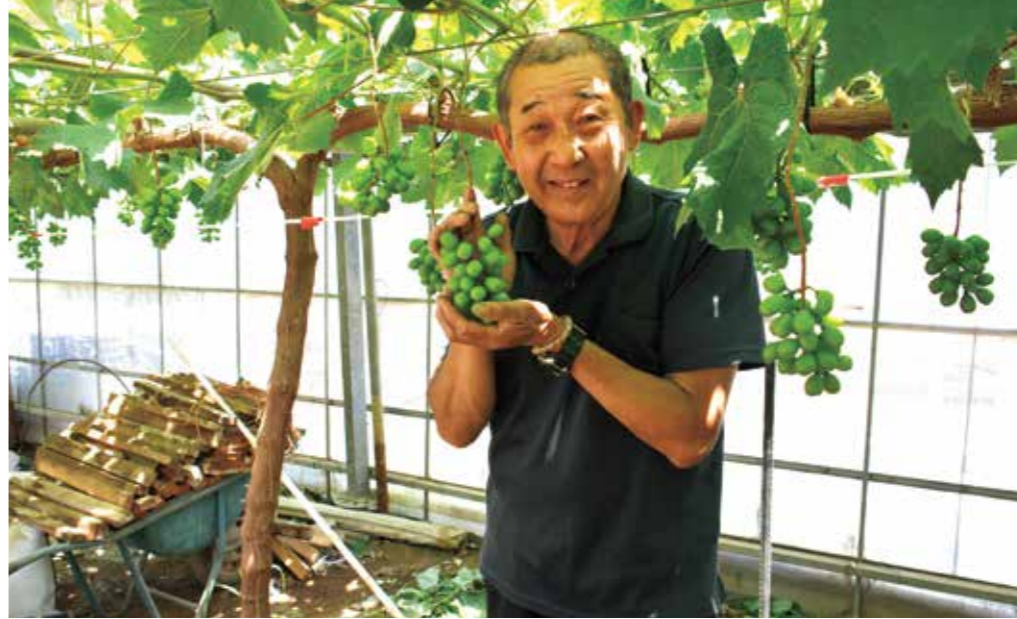
▲シャインマスカットは栽培してから今年で3年目。今年の8月に200房できる予定で、自宅の一角にある直売所でも購入できます。

農薬は3歳の頃に始めました。それまでは高校卒業後に白バイ隊員として働いていましたが、婿入りがかついで農業を始めました。農業を始めた頃は、農薬の知識