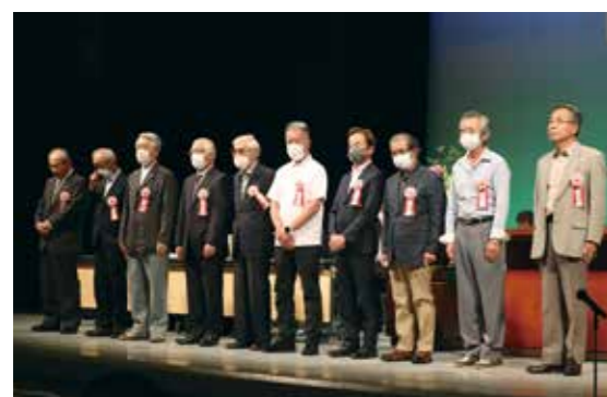
▲農家組合長表彰を受けた組合員