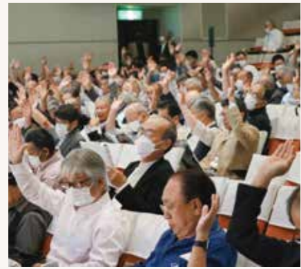
▲議案を採決する総代